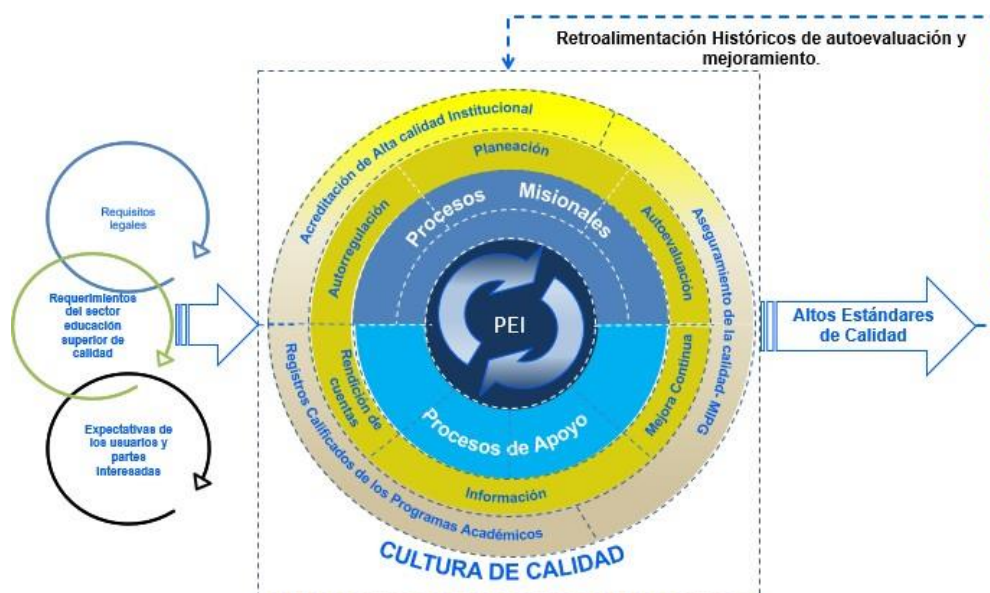
Figura 1. Sistema integrado de Aseguramiento de la Calidad de la Institución Universitaria Escuela Nacional del Deporte.