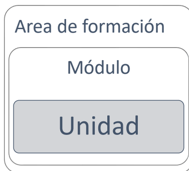
Gráfico 1. Diseño curricular postgrado