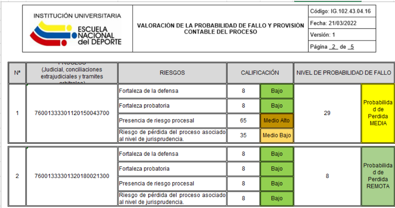
Matriz Riesgo de Pérdida del Proceso

Con corte a marzo de 2023 el riesgo de pérdida de los procesos en contra, se relaciona a continuación